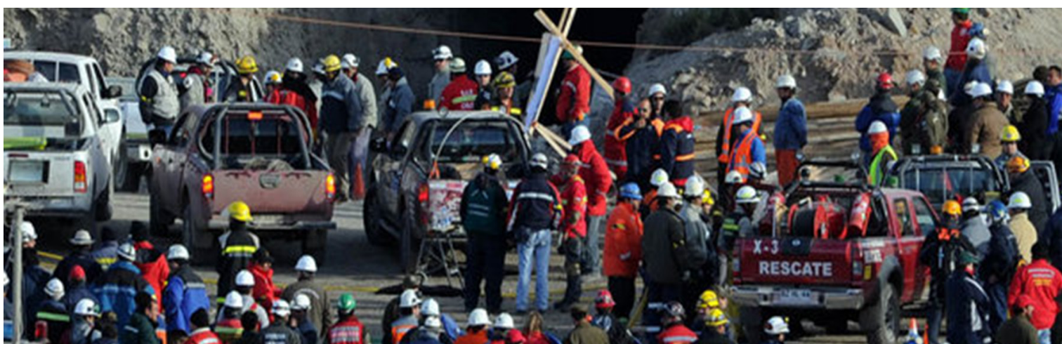
Equipes de resgate trabalham em busca de 34 trabalhadores que estão presos em uma mina no norte do Chile.

Na tentativa de conquistar os votos de Marina Silva, terceira colocada na eleição. A cúpula do PSDB se reuniu para buscar apoio dos integrantes do PV. Serra foi o primeiro a conversar com Marina, seguido pelo governador eleito de São Paulo, Geraldo Alckmin. Pág 1D