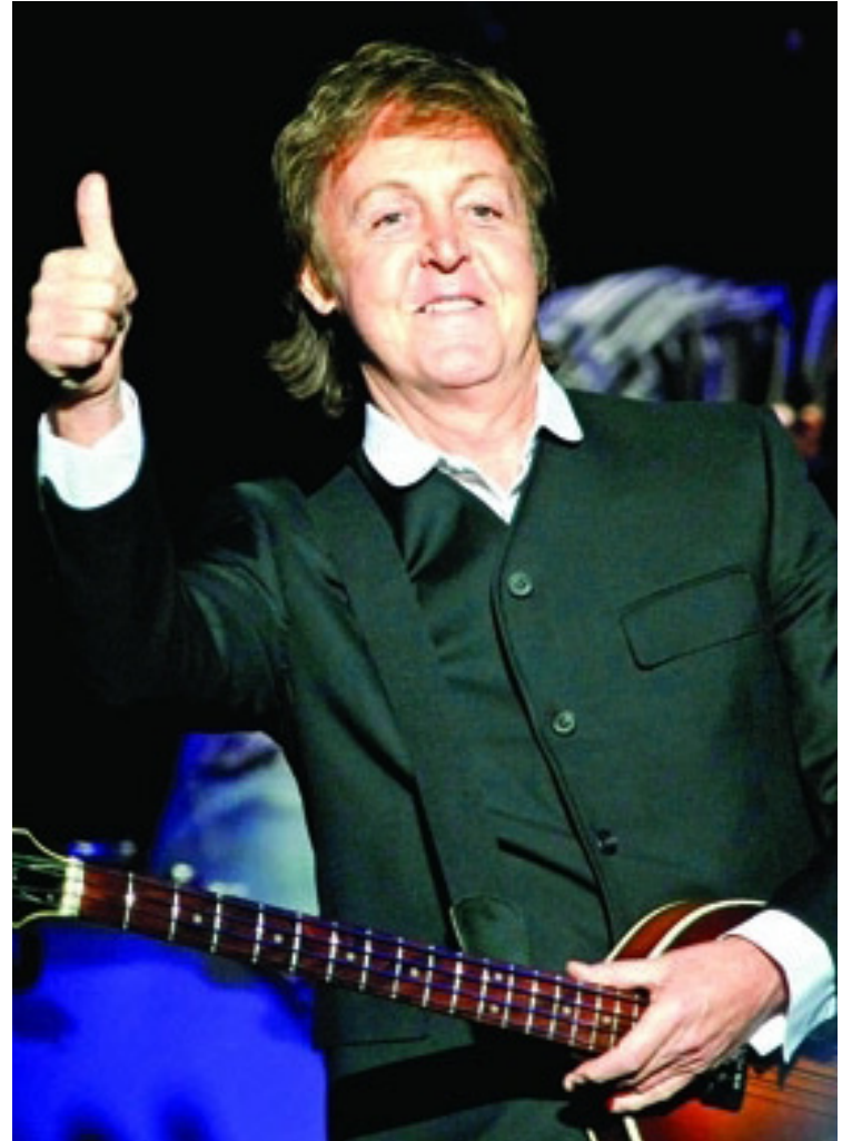
Três shows no Brasil em novembro.